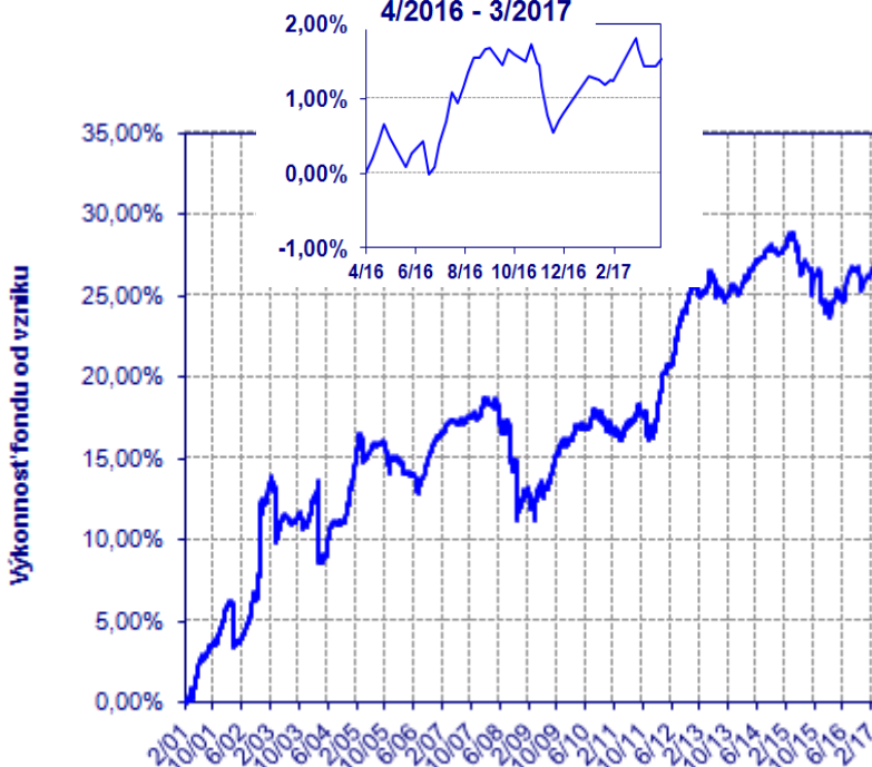
Výkonnosť fondu 4/2016 - 3/2017