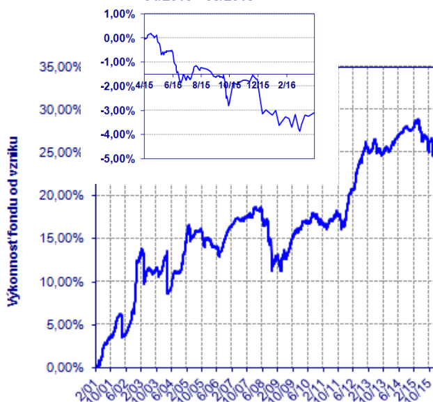
Výkonnosť fondu 04/2015 - 03/2016